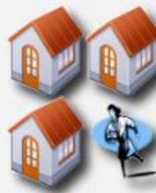
Atención Domiciliaria APS