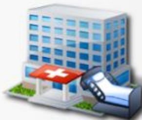
Gestión de Internación