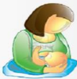
Sistema de Gestión Perinatal