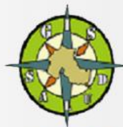
Sistema de Información Geográfico de Salud