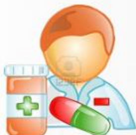
Sistema de Gestión de Farmacia